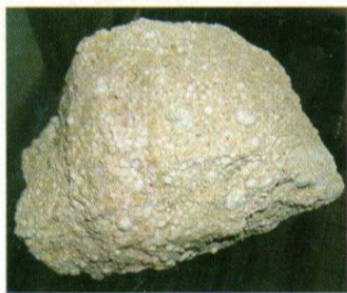
Bauxite à plus de 60% d'alumine - Sangarédi