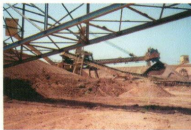
Roue-pelle de la CBG à Kamsar