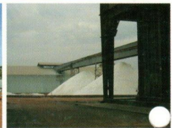
Alumine hydratée d'ACG - Fria