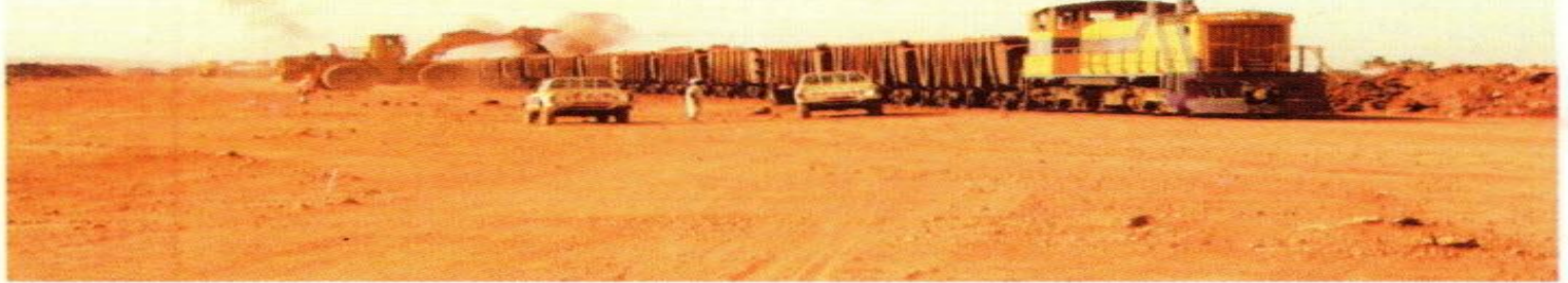
Chargement de Bauxite à Sangarédi (CBG)