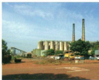
Raffinerie d'alumine d'ACG - Fria